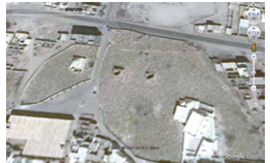
写真4 ガイル・バーフズィールの墓地、2016年1月。墓地の中に聖者廟が存在している。