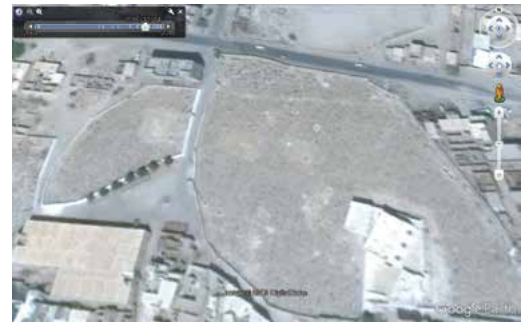
写真5 ガイル・バーフズィールの墓地、2016年11月。アルカーイダに破壊され、聖者廟があった場所が更地になっている。

を試みていたが、その時は画像だけで聖者廟かどうかを特定するのは困難で、実際に存在を確認した廟の場所を特定しただけだった。しかし、それ以後に撮影された衛星画像では聖者廟が廟らしく、具体的に言えば廟のドーム型の屋根が写っている（写真1、2参照）。そこで上から見ただけでどの程度の廟の存在が確認できるのか調べてみた。その結果、現時点で聖者廟と思われる構造物がハドラムウトに260程度存在することが分かった（写真3参照）。これを見ると、私が調査時に想像していた以上に聖者廟を建てる文化が沿岸部、内陸部のワーディーの隅々にまで広がっていることが分かる。