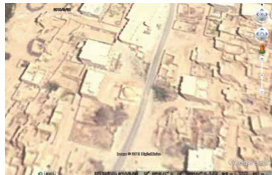
写真2 ジャドフィラ村の廟、2010年。ドームの形が分かる。